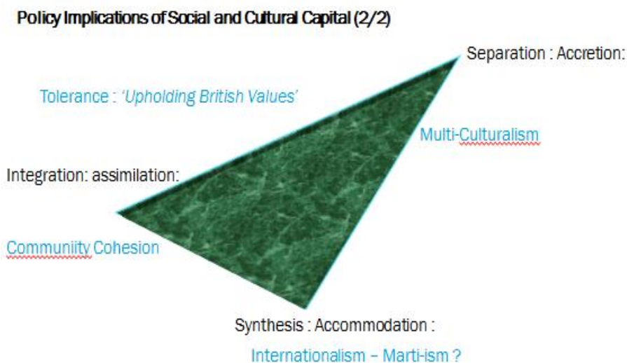
Figura 2. Nuevo modelo

América del Sur en particular Cuba, sugirió que cada generación se inventa para adaptarse a los nuevos retos que se enfrentan. La teoría post-moderna (eg Barthes,) hace hincapié en el papel del capital cultural y social en el enriquecimiento de las oportunidades. El primero está relacionado con tener un sentido de los valores culturales y la comprensión sobre el mundo, mientras que el segundo se refiere a las redes de contactos que uno puede recurrir para el adelanto.