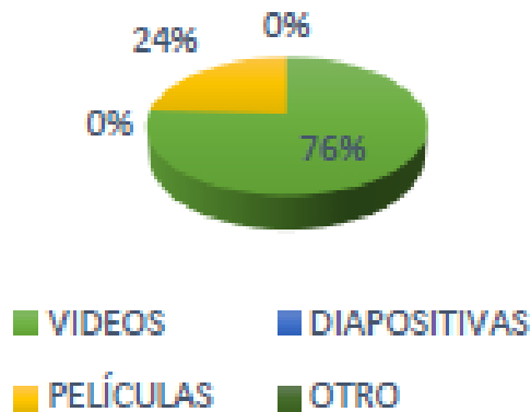
Gráfico 3: Material audiovisual de mayor aceptación.

Se evaluó el material audiovisual utilizado cual consideró que sería más útil en las clases de inglés, el 76% (22) estudiantes piensan que los videos les serían más útiles en las clases de, sin embargo un 24% (7) de ellos opinaron que las películas también les pueden servir de apoyo en la materia. La opinión de los alumnos en esta pregunta permite interpretar que los videos les atraen más como material de apoyo, ya que son más cortos que una película y les brindan entretenimiento al mismo tiempo que conocimientos, por lo tanto les son de mucha utilidad en las clases de inglés.